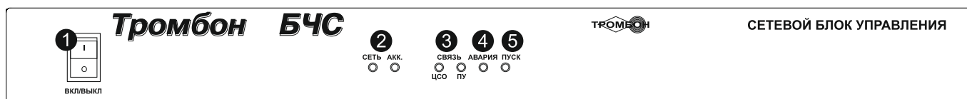
Рис. 1. Блоки «Тромбон БЧС» и «Тромбон БЧС-М». Эскиз передней панели

Начальная настройка Блока при инсталляции выполняется через WEB интерфейс, при помощи компьютера с любым браузером, подключенного к порту Ethernet Блока. При наличии установленной связи между Блоком и ЦСО, дальнейшее управление Блоком и изменение его настроек возможно администратором автоматизированного рабочего места оператора «Тромбон ЦСО».