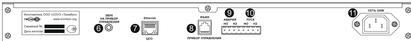
Рис. 2. Блок «Тромбон БЧС». Эскиз задней панели